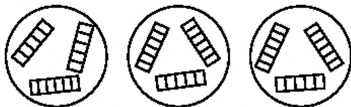
Рисунок 1 — Схема расположения подставок с образцами в эксикаторах

6.1 Для каждого варианта опыта испытывают 18 образцов: по 6 шт. на каждой из трех групп грибов (рисунок 1).