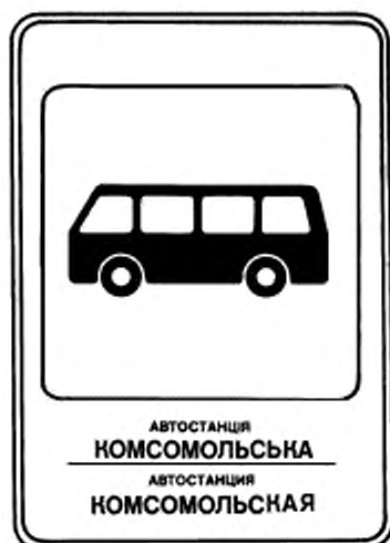
5. Указатель остановки междугородных автобусов