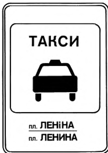
7. Указатель остановки легковых такси