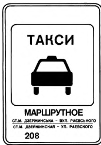
6. Указатель остановки маршрутных такси