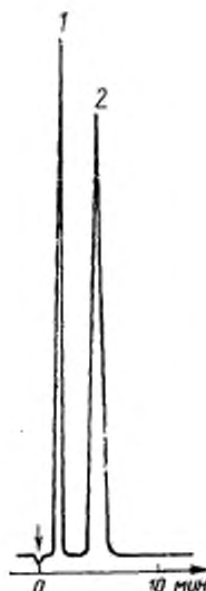
Хроматограмма образца лосьона (детектор ионизации в пламени)

1—этиловый спирт; 2—пропиловый спирт (эталон)