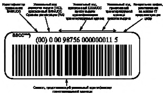
Рисунок В.1 — Пример представления уникальной идентификации транспортируемых единиц в символе штрихового кода EAN/UCC 128 с идентификатором применения EAN/UCC «00» и визуальным представлением

В.1 Пример представления уникальной идентификации транспортируемых единиц в символе штрихового кода EAN/UCC 128* с идентификатором применения EAN/UCC** «00» и визуальным представлением приведен на рисунке В.1.