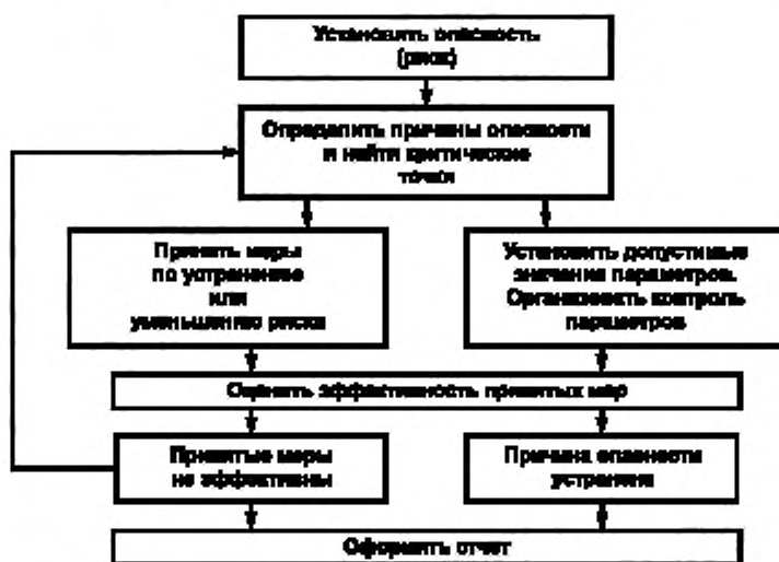
Рисунок 2 — Схема работы по анализу рисков

Анализ рисков носит циклический характер, направленный на систематическое повышение надежности всей производственной цепи. Схема работы приведена на рисунке 2.