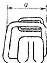
Рисунок 1 — Участок захвата руками

2.4 Бензопилы с рабочим объемом цилиндра двигателя 80 см 3 и более должны устанавливаться на плоской горизонтальной поверхности, устойчиво опираясь на основание бензопилы, как показано на рисунке 2.