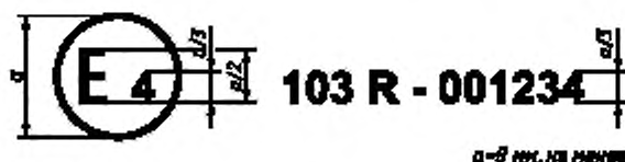
Образец А (См. 4.4 настоящих Правил)

Приведенный выше знак официального утверждения, проставленный на элементе сменного каталитического нейтрализатора, указывает, что данный тип был официально утвержден в Нидерландах (E4) на основании настоящих Правил под номером официального утверждения 001234. Первые две цифры номера официального утверждения означают, что официальное утверждение было предоставлено в соответствии с предписаниями настоящих Правил в их первоначальном виде.