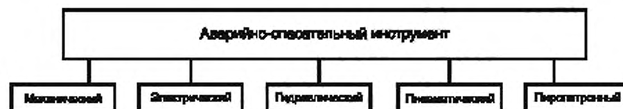
Рисунок А.2 — Схема классификации АПИ по признаку «Вид источника энергии (привода), принцип действия исполнительного устройства»