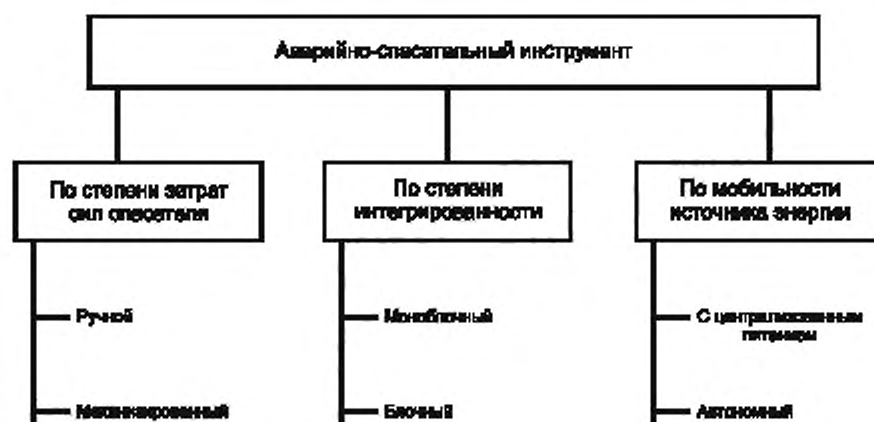
Рисунок А.3 – Схема классификации АПИ по признаку «Конструктивное исполнение инструмента»