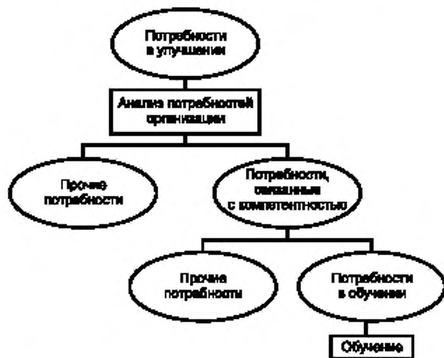
Рисунок 1 — Повышение качества посредством обучения

Настоящий стандарт устанавливает требования при идентификации и анализе потребностей в обучении, планировании и составлении программы обучения, проведении обучения, оценке результатов обучения, а также при мониторинге и улучшении процесса обучения для достижения поставленных целей. В стандарте подчеркнута особая важность обучения при решении задач по постоянному улучшению. Обучение должно стать результативным и эффективным способом вложения инвестиций организации.