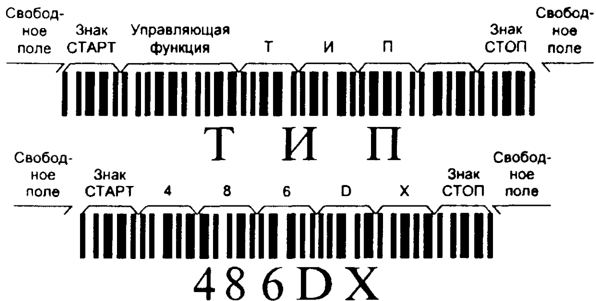
Рисунок Е.2 — Символы штрихового кода, в которых закодированы данные ТИП 486DX

Е.7 При необходимости обеспечения дополнительной надежности при передаче данных с буквами русского алфавита используют контрольный знак символа набора «Кода 39РУС».