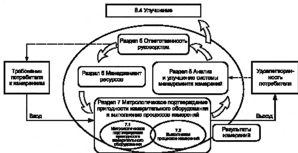
Рисунок 1 — Модель системы менеджмента измерений

Одним из установленных принципов менеджмента качества в ИСО серии 9000 является процессный подход. В системе менеджмента измерений процессы измерений следует рассматривать как специальные процессы, направленные на обеспечение требуемого качества продукции, выпускаемой организацией. Модель системы менеджмента измерений, соответствующая настоящему стандарту, представлена на рисунке 1.