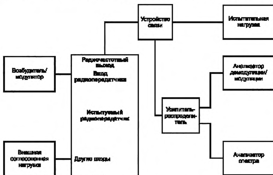
Рисунок 3 — Конфигурация оборудования при испытаниях: радиовещательные передатчики DRM [6] и T-DAB [7]

- для радиовещательных передатчиков DRM (см. [6]) и T-DAB (см. [7]) — на рисунке 3.