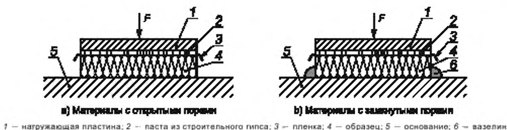
Рисунок 1 — Возбуждение нагружающей пластины. Измерение вибрации нагружающей пластины

В пределах указанных интервалов проводят измерения не менее чем при трех значениях возбуждающей силы.