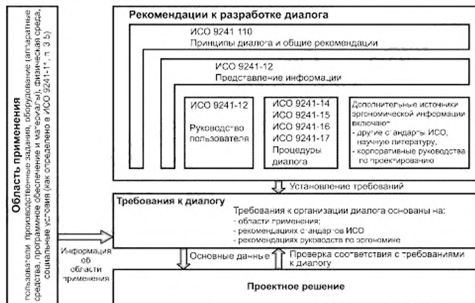
Рисунок 1 — Структурная схема применения настоящего стандарта

Настоящий стандарт является основой для установления требований к организации диалога, однако не определяет непосредственно эти требования. Требования к организации диалога зависят от области применения, для которой интерактивная система разработана и/или в которой ее используют, и требований, разработанных для этой области применения.