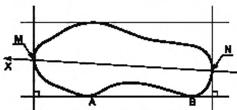
Рисунок 1 — Расположение оси X