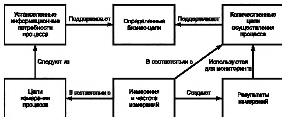
Рисунок 1 — Взаимосвязи между понятиями, относящимися к атрибуту измерения процесса

На рисунке 1 показаны взаимосвязи между некоторыми важными понятиями, относящимися к атрибуту измерения процесса.