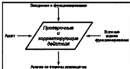
Рисунок 5 — Проверка и корректирующие действия