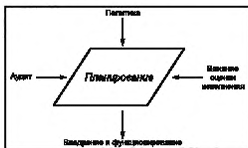
Рисунок 3 — Планирование