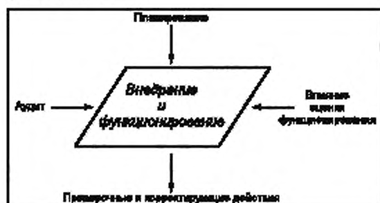
Рисунок 4 — Внедрение и функционирование