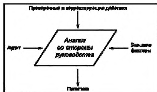
Рисунок 6 — Анализ со стороны руководства