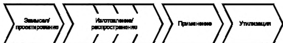
Рисунок 1 — Жизненный цикл продукции и передача информации

Этот процесс требует использования методологии, позволяющей представлять описание продукции в стандартизованной машинно-ориентированной форме, приемлемой для большинства промышленных систем. Подобная методология определена международными стандартами МЭК 61360-1 и ИСО 13584-42 и должна быть реализована как внутри компаний, так и при взаимодействии с бизнес-партнерами для того, чтобы она стала общепринятой практикой, повышающей эффективность и экономичность электронных коммерческих процессов.