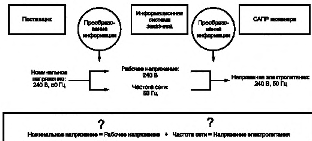
Рисунок 2 — Возможность или невозможность реального обмена информацией

Традиционно информация о продукции всегда была доступна в виде справочных технических листов и каталогов на бумажных носителях. С быстрым ростом информационных средств сбора, передачи и обработки этой информации к изготовителям стали предъявлять повышенные требования относительно ее предоставления в машинно-ориентированной форме, позволяющей избежать задержек и ошибок, присущих информации, переводимой с бумажных носителей на электронные. Кроме того, подобный перенос следует проводить с учетом стандартизованных методик, которые, при их применении, обеспечивали бы обмен информацией, ее функциональную совместимость как в пределах одного предприятия, так и между контрагентами вне его. Рисунок 2 иллюстрирует некоторые проблемы, которые могут возникать в информационной цепочке поставщика.