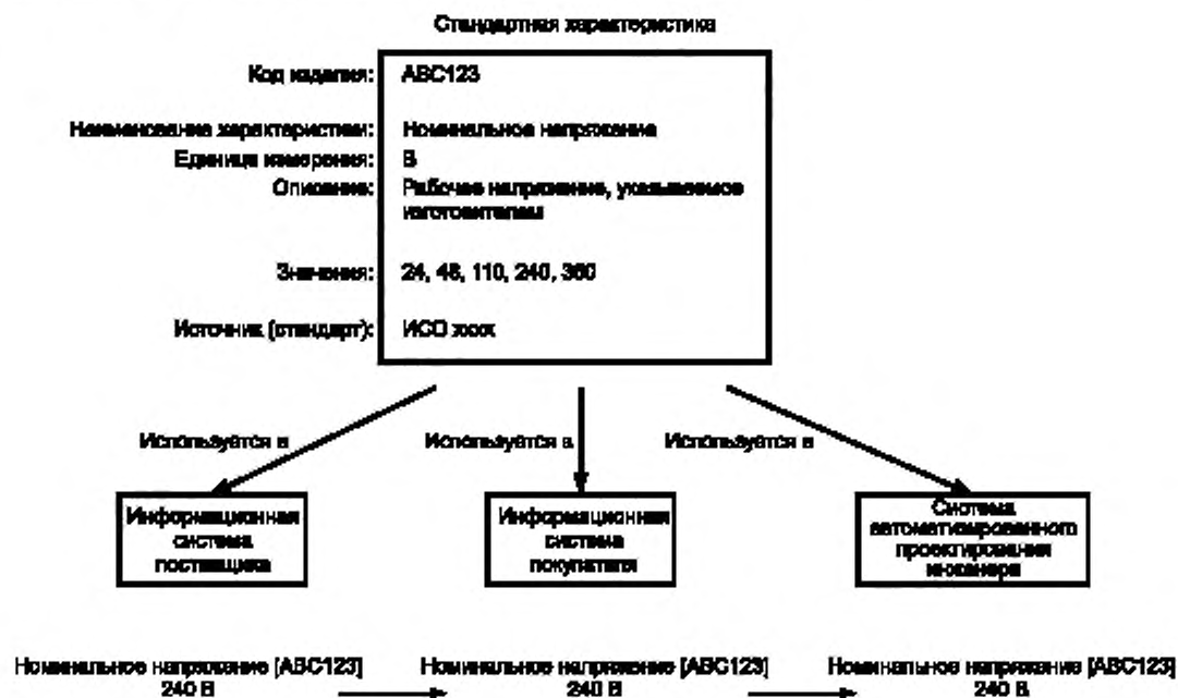
Рисунок 3 — Многократное использование характеристик продукции

каталогов продукции или библиотек информации о продукции в доступной для компьютера форме и в соответствии с общеизвестными и утвержденными методиками.