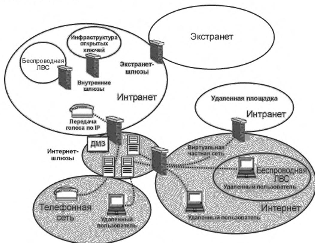
Рисунок 1 — Типовое построение сетевой среды

Пример типового построения сети, которое используют в настоящее время во многих организациях, представлен на рисунке 1.