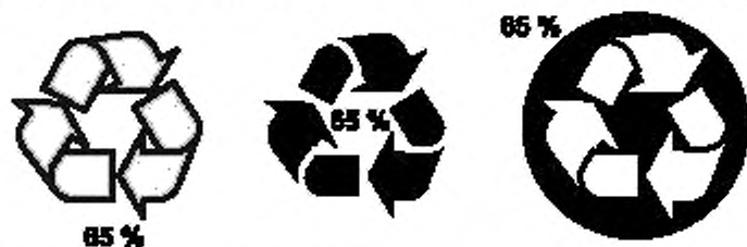
Рисунок 2 — Примеры допустимого размещения значения в процентах при использовании ленты Мебиуса

7.8.3.5 Используемый знак может сопровождаться идентификацией материала.