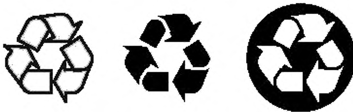
Рисунок 1 — Примеры ленты Мебиуса

5.10.2.1 Лента Мебиуса — знак, имеющий форму трех закрученных стрелок, образующих треугольник. Форма знака должна соответствовать требованиям к знаку № 1135 ИСО 7000. Знак должен быть контрастным и четко различимым. Примеры вида ленты Мебиуса приведены на рисунке 1.