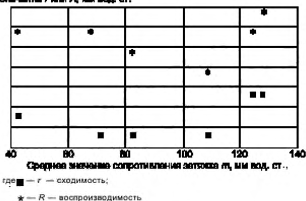
Рисунок В.1 — Зависимость r или R от m (для сигарет)

Так как на рисунке В.1 отсутствует явная корреляция r и R со средними значениями m , то по данным таблицы В.3 были рассчитаны средние значения r и R , которые и представлены в таблице В.2.