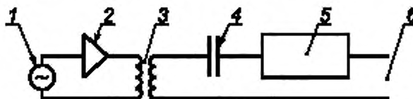
1 — генератор сигналов; 2 — широкополосный усилитель с регулируемым усилением; 3 — трансформатор с коэффициентом трансформации 1; 4 — конденсатор емкостью 2 мкФ, 5 — резистор сопротивлением 50 Ом; 6 — выходные зажимы устройства связи

При проведении испытаний применяют испытательную установку по приложению А, а также генератор сигналов и устройство связи в соответствии с рисунком 2.