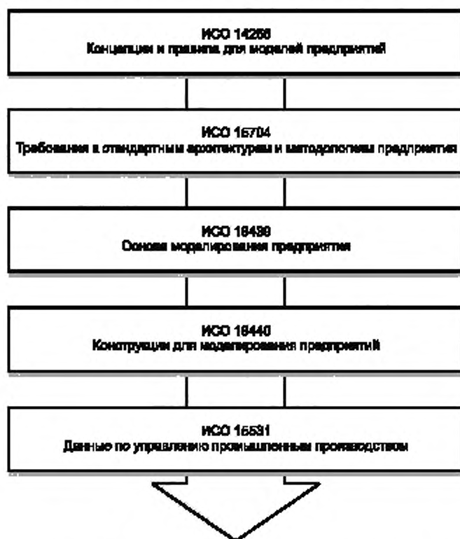
Рисунок 1 — Иерархия объектов стандартов в области моделирования архитектуры и интеграции предприятия

На рисунке 1 приведена иерархия объектов, описанных в основополагающих стандартах в области моделирования архитектуры и интеграции предприятия, определяющая последовательность изучения стандартов и их использования для целей моделирования предприятий. На рисунке 2