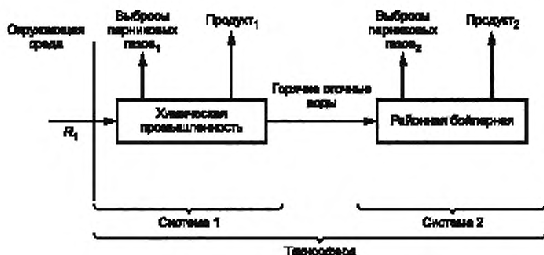
Рисунок 1 — Незамкнутый цикл