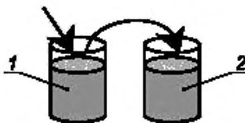
1 — стакан с пробой моторного топлива (промывка); 2 — стакан с пробой моторного топлива (измерение)

5.2.1 Измерительный датчик анализатора устанавливают поочередно в стаканы (рисунок 1), предварительно наполнив их измеряемой пробой.