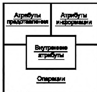
Рисунок 1 — Общая схема определения доступности графических значков

На рисунке 2 представлена детальная схема определения доступности графических значков, которая расширяет каждое понятие (идентификация, атрибуты описания, атрибуты представления и операции) в некоторое количество определенных компонентов. При этом учитывается, что значки часто располагаются и используются группой, а не по отдельности, и, следовательно, доступность включает в себя действия группового уровня. Каждый компонент значка, представленный в данной схеме, может вносить свой вклад в формирование доступности значка и является предметом рассмотрения в настоящем стандарте. Свойства, определенные в ISO/IEC TR 11580, реализованы в настоящем стандарте как атрибуты значка.