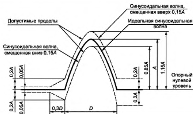
Рисунок 2 – Форма полусинусоидального импульса ускорения и его допустимые пределы

D – продолжительность действия импульса ускорения, с.