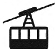
ИСО 7001-0033 Канатная подвесная дорога с большими кабинами (информация для публики)