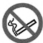
ИСО 7010-P002 Не курить! (запрещение)