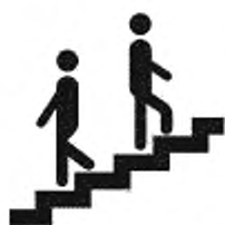
ИСО 7001-0011 Лестница (информация для публики)