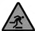
ИСО 7010-W007 Предупреждение, препятствия (предупреждение)