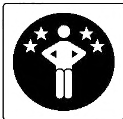
Рисунок Л.2 — Спуск в темноте