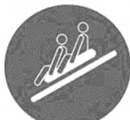
Рисунок И.8 — Пользоваться многоместным рафтом