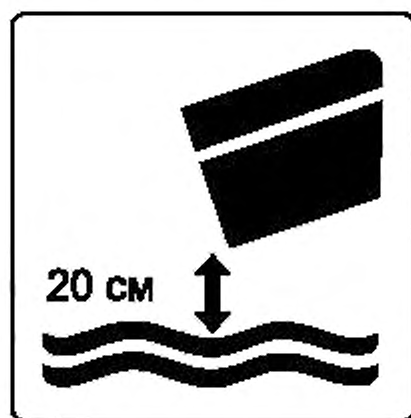
Рисунок Л.3 — Высота падения в воду при завершении спуска