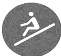
Рисунок И.3 — Положение сидя лицом вперед