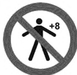
Рисунок К.3 — Детям старше 8 лет спуск запрещен