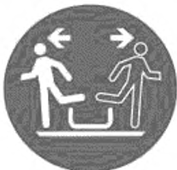
Рисунок И.6 — Немедленно покинуть специальное приемное устройство