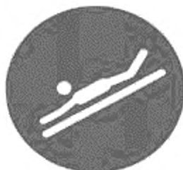
Рисунок И.2 — Положение на животе головой вперед