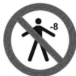
Рисунок К.4 — Детям младше 8 лет спуск запрещен