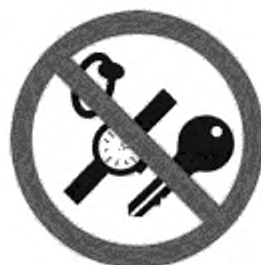
Рисунок К.6 — Запрещен спуск с посторонними предметами