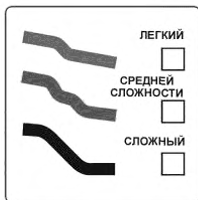
Рисунок Л.1 — Степень сложности спуска