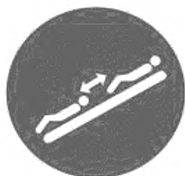
Рисунок И.10 — Соблюдай дистанцию