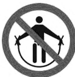
Рисунок К.5 — Запрещено держаться за борта трассы спуска