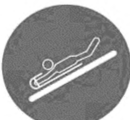
Рисунок И.9 — Пользоваться ковриком