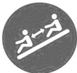
Рисунок И.11 — Соблюдай дистанцию