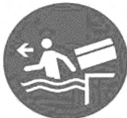
Рисунок И.5 — Немедленно покинуть зону финиша