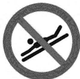
Рисунок К.1 — Положение на животе головой вперед запрещено