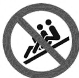
Рисунок К.2 — Спуск цепочкой запрещен