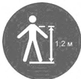
Рисунок И.13 — Минимальный рост для конкретной горки