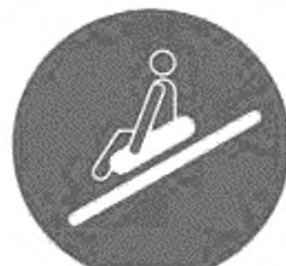
Рисунок И.7 — Пользоваться одноместным рафтом