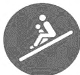
Рисунок И.4 — Положение сидя ребенка перед взрослым, лицом вперед