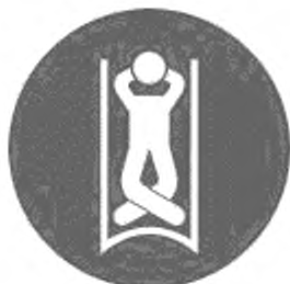
Рисунок И.14 — Положение на спине головой назад, ноги скрещены, руки за головой