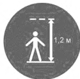
Рисунок И.12 — Максимальный рост для конкретной горки