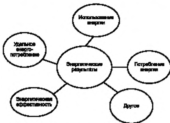
Рисунок А.1 — Концептуальное представление энергетических результатов

Концептуальное представление энергетических результатов приведено на рисунке А.1.