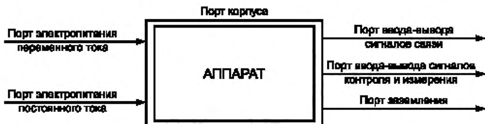
Рисунок 1 — Основные типы портов