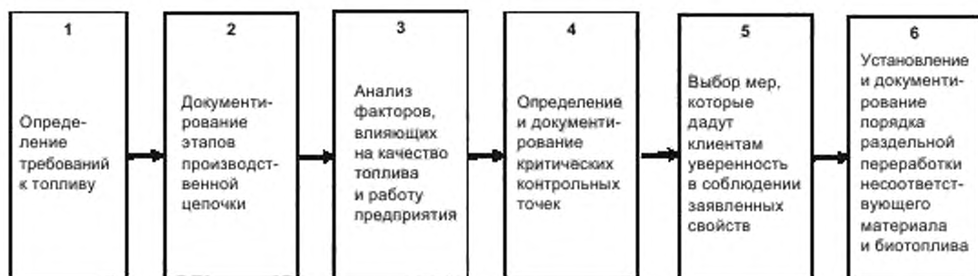
Рисунок 4 — Методология подтверждения качества

Выделяют шесть последовательных этапов. Этапы показаны на рисунке 4 и описаны ниже.