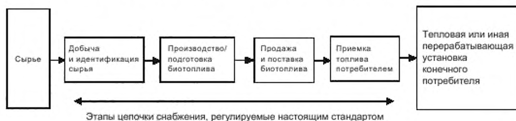
Рисунок 1 — Схема снабжения твердым биотопливом

Цепочка снабжения твердым биотопливом обычно состоит из этапов, показанных на рисунке 1.