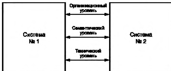
Рисунок 1 — Эталонная модель интероперабельности

Эталонная модель интероперабельности представляет собой развитие семиуровневой базовой эталонной модели ВОС согласно ГОСТ Р ИСО/МЭК 7498-1—99 (рисунок 1), [3], [4].