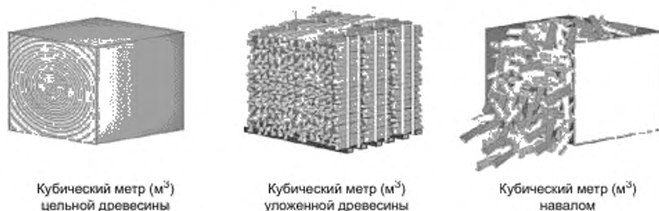
Рисунок Б.1 — Сравнение различных кубических метров

Примечание — Три кубических метра навалом примерно соответствуют двум кубическим метрам уложенной древесины.