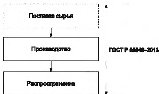
Схема 1 — Упрощенный пример цепочки поставки древесной щепы

Цепочка поставки имеет три части, как показано на схеме 1.