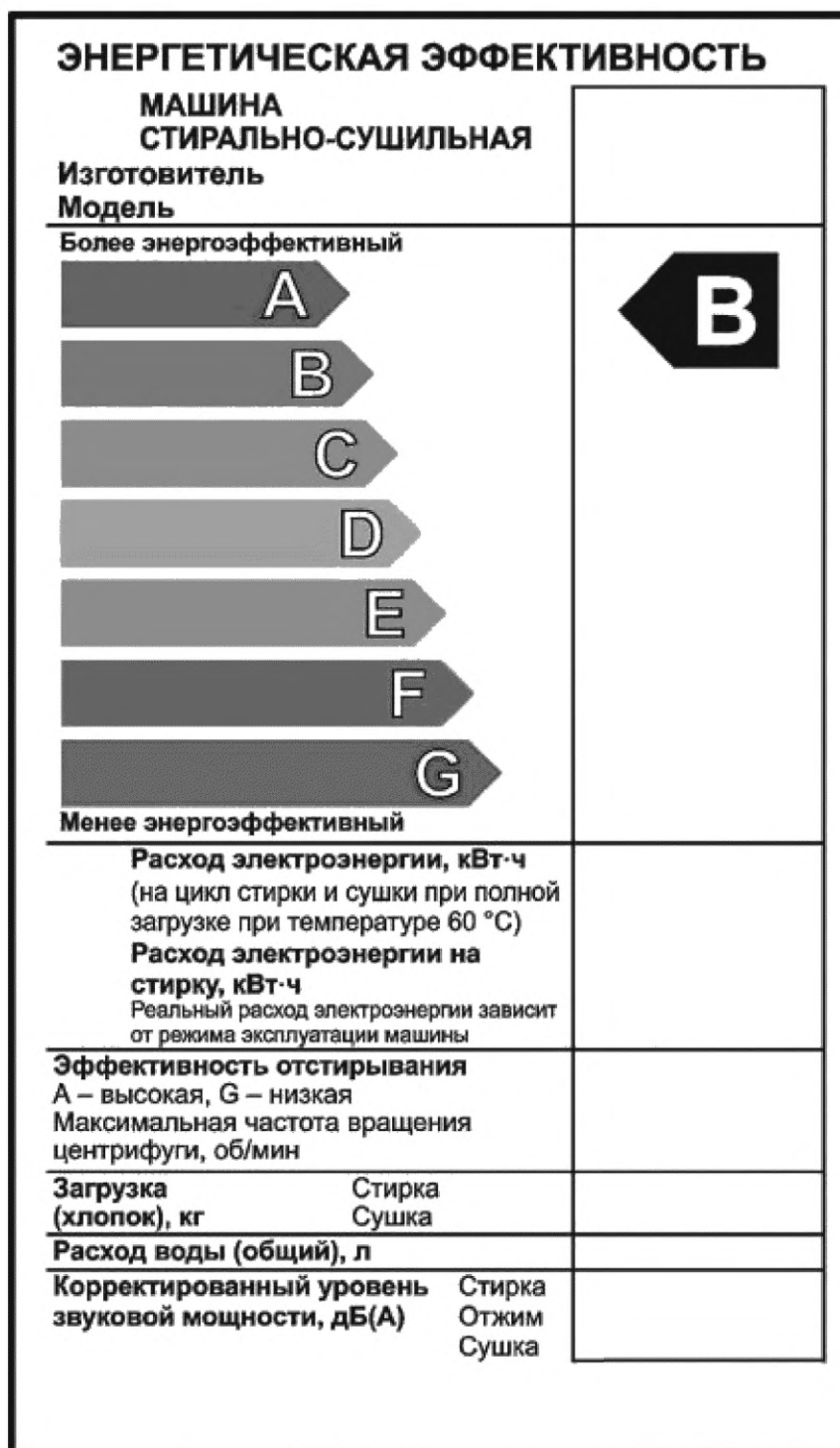
Рисунок А.1 — Вид этикетки энергетической эффективности стирально-сушильных машин

А.1 Маркировка представлена на рисунке А.1.