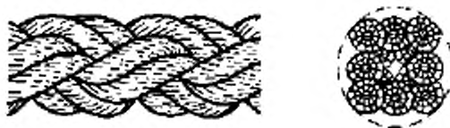
Рисунок 2 – Конфигурация 8-рядного плетеного каната (тип L)