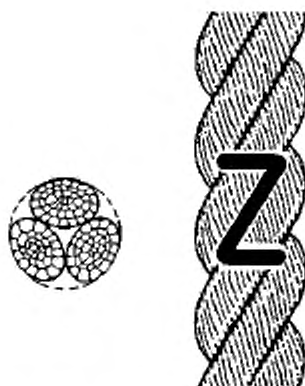
Рисунок 1 – Конфигурация 3-рядного (hauser-laid) каната (тип А)