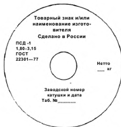
Рисунок А.2 — Расположение маркировки на ярлыке, прикрепленном к катушке

Для поставки на внутренний рынок и рынки стран СНГ