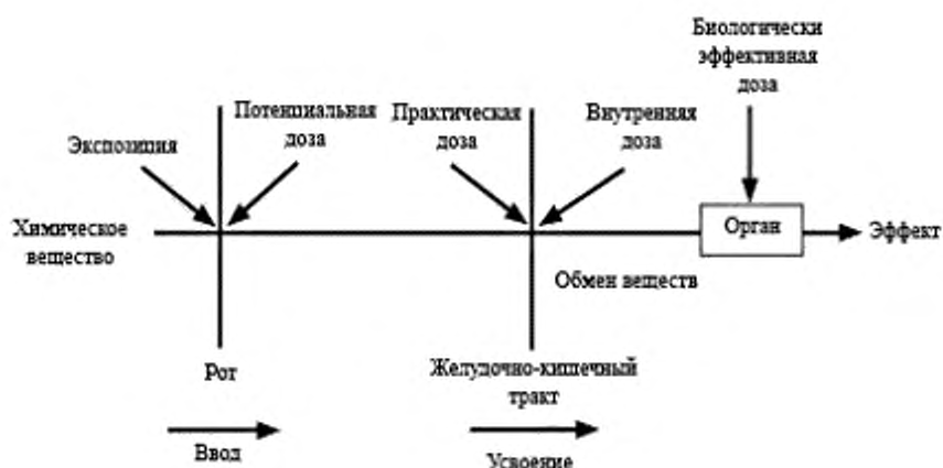
Рисунок 2 — Схема влияния дозы и экспозиции для орального способа воздействия химического вещества, содержащегося в сельскохозяйственной продукции

Далее в качестве примера приведено возможное отнесение различных требований к категориям, представленным в таблице 2.