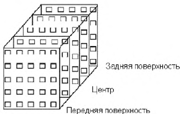
Рисунок 1 – Размещение дозиметров для картирования дозы в контейнере с продуктом в случае фотонного облучения.

Примечание — При проведении исследований, связанных с подавлением паразитов, патогенных бактерий, вирусов и т.п., часто используют небольшие образцы, с тем чтобы минимизировать количество пищевого или сельскохозяйственного материала, зараженного данной биологической компонентой. Такая практика способствует ограничению распространения инфекционного биологического агента и облегчает лабораторному персоналу безопасную работу с материалом в контролируемой обстановке. Эти образцы могут иметь очень малый объем и вес. В этом случае исследователь может использовать небольшие дозиметры для получения карты поглощенных доз в незараженном материале. В тех случаях, когда материал, подлежащий облучению, имеет размеры порядка нескольких миллиметров или массу порядка нескольких граммов, дозиметры могут прикрепляться к стенкам контейнеров, содержащих образцы, и в такой конфигурации измеряется поглощенная доза.