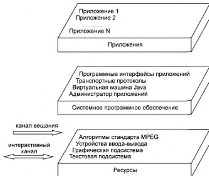
Рисунок 1 — Базовая архитектура МНР

5.3.2 Приложения платформы представляют собой функциональные реализации программного обеспечения, работающие в одном или в нескольких взаимодействующих аппаратных объектах.