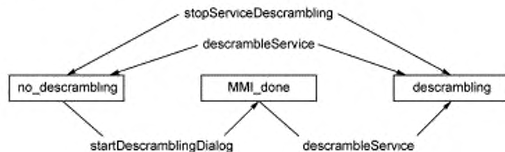
Рисунок 3 — Изменение состояния системы CA

По умолчанию система (класс CAModule) устанавливается в состояние «дескремблирование не введено». В этом состоянии дескремблирование не выполняется. Переход в состояние «дескремблирование введено» может быть выполнен двумя способами. Первый способ реализуется прямым вызовом метода startDescrambling. После вызова этой функции начинается процесс дескремблирования. В этом случае представление информации может включать диалоги пользователя по запросам системы CA. Если дескремблирование при использовании первого способа невозможно, то применяется второй способ, который заключается в вызове метода startDescramblingDialog. Это заставляет систему CA в случае необходимости начинать диалог с пользователем и ввести состояние «готовность интерфейса MMI» MMI_done. После этого состояние «дескремблирование введено» может быть достигнуто вызовом метода startDescrambling.