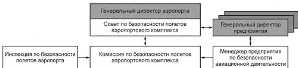
Рисунок 3 — Вариант организационной структуры СМБ аэропортового комплекса

На рисунке 3 приведен вариант организационной структуры СМБ АД аэропортового комплекса.