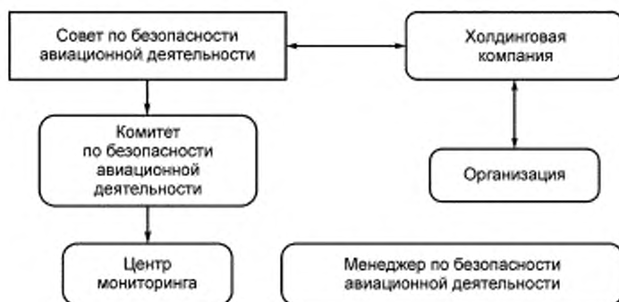
Рисунок 2 — Определение места организации в СМБ АД

Рисунок 2 дает представление об определении организации в общей системе СМБ АД для выявления ее масштабов и структуры.