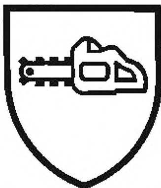
Рисунок 2 — Пиктограмма, указывающая на защиту от разрезания цепной пилой

Помимо этого, пиктограмма, показанная на рисунке 2 вместе с уровнем обеспечиваемой защиты (уровень 1, уровень 2 или уровень 3), должна быть указана на ярлычке размерами не менее (30 × 30) мм, прикрепленном на хорошо просматриваемом месте снаружи обуви.