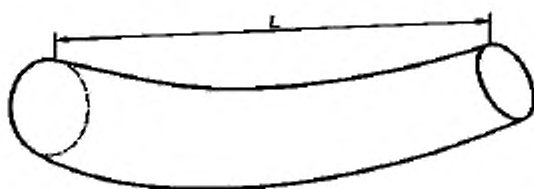
Рисунок 2 — Бревно с кривизной

Длину бревна с кривизной измеряют таким же образом, как и длину прямого бревна (рисунок 2).