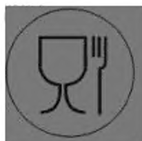
Рисунок Б.1— Для пищевых продуктов

Б.2. Символы и пиктограммы, наносимые на изделие или этикетку, или упаковочный лист (вкладыш), характеризующие кронен-пробки по назначению,— см. рисунки Б.1 и Б.2.