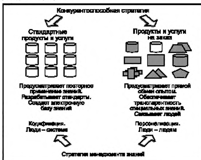
Рисунок 3 — Две общие стратегии МЗ

Эмпирические данные предполагают, что организации начинают работу по внедрению первой инициативы по МЗ в основном в таких областях, которые они рассматривают как свою основную компетентность, также как маркетинг и продажи, исследования и разработки или производство. В связи с этим возможный подход может начинаться с выбора производственной области или процессов, которые должны поддерживаться МЗ, как это представлено на рисунке 4.