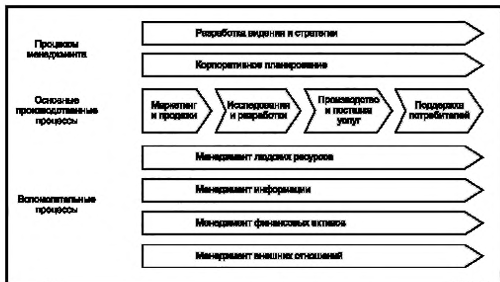
Рисунок 4 — Пример организационной карты процесса

Если организация нацелена на постоянную инновацию своего продукта, в этом случае инициатива по МЗ может улучшить менеджмент знания, необходимый для разработок, создать сетевые отношения с внешними исследовательскими подразделениями в университетах, и организации могут пригласить на работу брокера по знаниям для постоянного поиска самых последних инноваций и патентов в рамках производственной области.