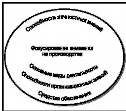
Рисунок 1 — Основа менеджмента знаний: европейская перспектива

2 Пять основных видов деятельности в отношении знаний были идентифицированы как наиболее широко применяемые: идентификация, создание, хранение, обмен знаниями и их применение. Они представляют собой второй компонент основы посредством формирования единого процесса.