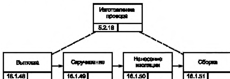
Рисунок В.6 — Процесс изготовления проводов изделия GT-350 [5]

Набор проводов изделия GT-350 изготавливают как сборочный агрегат изделия GT-350. Технологический процесс организуют в цехе проводов и кабелей.