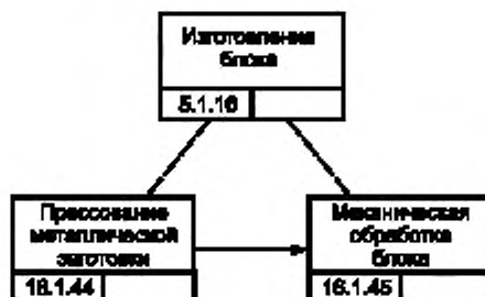
Рисунок В.3 — Процесс изготовления блока изделия GT-350 [5]

Блок изделия GT-350 выполняется как агрегат для сборки двигателя изделия GT-350. Изготовление блока требует выполнения всех технологических операций, начиная от литья заготовки и ее механической обработки (см. рисунок В.3).