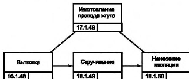
Рисунок В.5 — Процесс изготовления провода жгута [5]

Данное представление формализует спецификацию технологического процесса на рисунке В.5. В данном представлении соотношение «soo_precedes» используется для спецификации упорядочивающих ограничений для событий «make_harness_wires» (изготовление проводов жгута) и «assemble_wires» (сборка проводов). Каждая стрелка на рисунке В.5 соответствует формуле «soo_precedes». Функция «soomap» используется для выделения возможных многозначных событий.