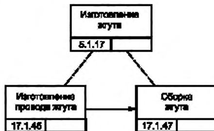
Рисунок В.4 — Процесс изготовления жгута изделия GT-350 [5]

Жгут изделия GT-350 (см. рисунок В.4) изготавливают как сборочный агрегат двигателя изделия GT-350. Данный технологический процесс организован в цехе кабелей и проводов. Рисунок В.5 представляет процесс изготовления провода жгута. Жгут изделия GT-350 собирается на особом стенде из проводов и кабелей. Сборка одного жгута требует 10 мин.