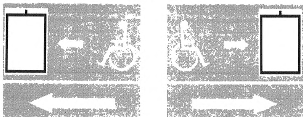
Рисунок В.1 — Указатель направления движения к эвакуационному лифту

Размер пиктограммы должен быть не менее 200 × 150 мм и иметь соответствующую подсветку.