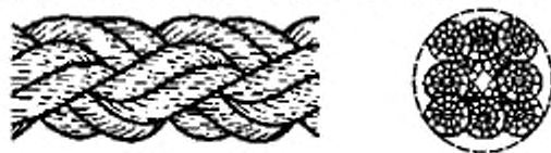
Рисунок 3 — Конфигурация 8-рядного плетеного каната (тип L)

5.2 Конструкция, изготовление, шаг крутки, маркировка, упаковка и поставляемые длины должны соответствовать ISO 9554.